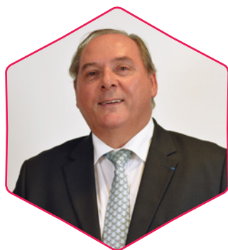
Dominique BOURGOIS (MEDEF)