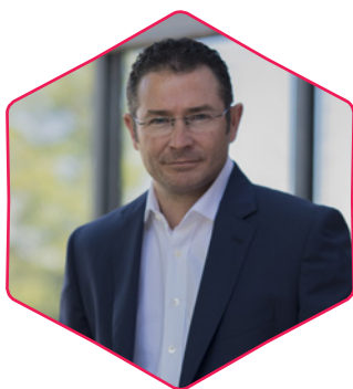
Frédéric CARRÉ (MEDEF)