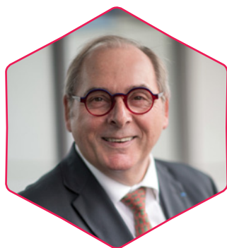
Dominique BOURGOIS (MEDEF)