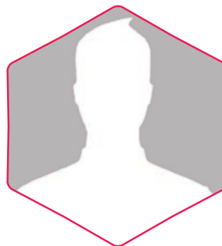
Election prévue en septembre 2020