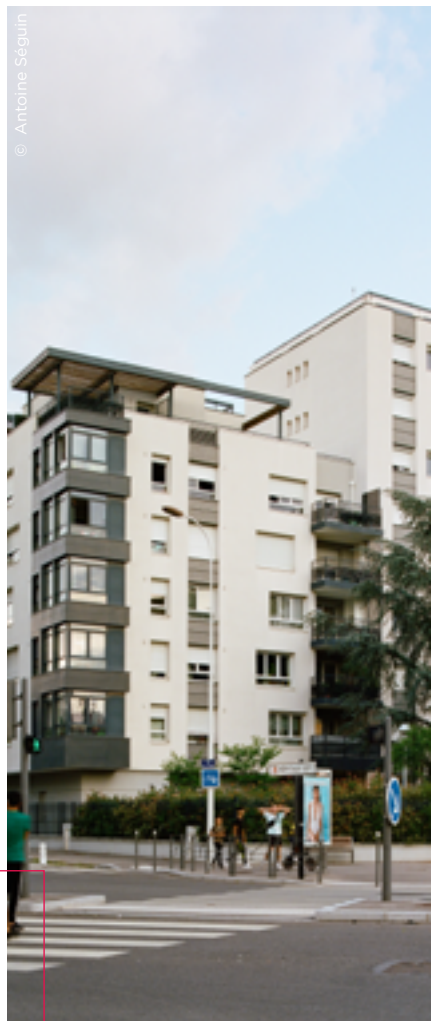
Alliade Habitat - Résidences Louis Bastié et Maryse Bastié, à Lyon (69)