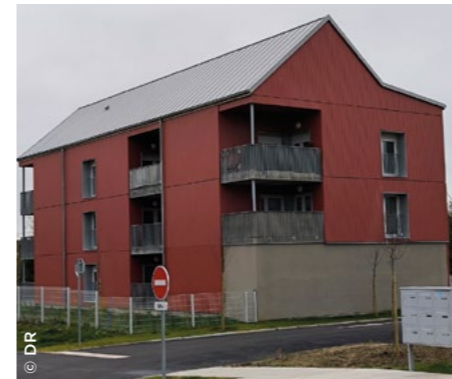
À Chalette-sur-Loing (45), le nouvel ensemble immobilier Ponte de Lima (Valloire Habitat).