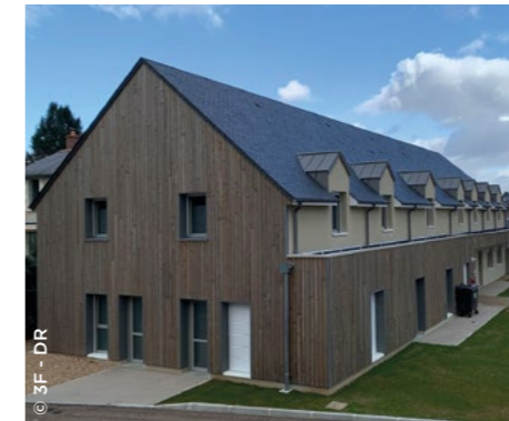
À Artannes-sur-Indre (37), La Vallée de Lys comprend un cabinet médical (3F Centre Val de Loire).