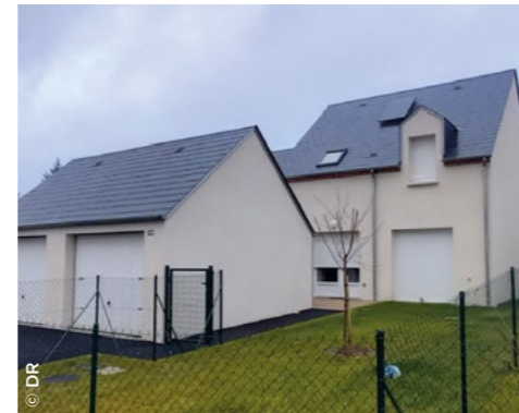
À Chécy (45), La Cigogne, 6 maisons individuelles en locatif social (Valloire Habitat).