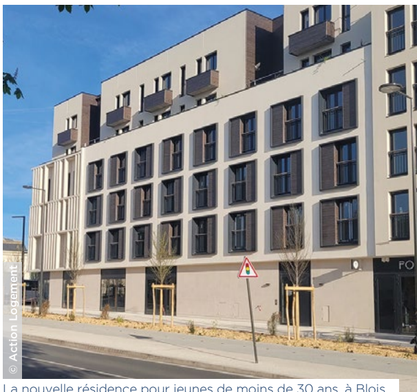
La nouvelle résidence pour jeunes de moins de 30 ans, à Blois.

Le Groupe est engagé activement dans le programme national Action Cœur de Ville, à la fois par l'intervention de ses filiales immobilières et par le soutien financier d' Action Logement Services dans des opérations d'acquisition-amélioration, de démolition-reconstruction, ou encore de construction neuve. En 2024, il accompagne dans la région plus de 20 projets pour redynamiser le centre de villes moyennes, à Blois (41), Bourges (18), Chinon (37), Dreux (28), Issoudun (36), Nogent-le-Rotrou (28), Pithiviers (45), Romorantin-Lanthenay (41) ou encore Vierzon (18). Quinze d'entre eux auront été livrés entre janvier et août 2024. Des opérations sont également prévues à Chartres et Châteaudun (28), Châteauroux (36), Gien et Montargis (45).