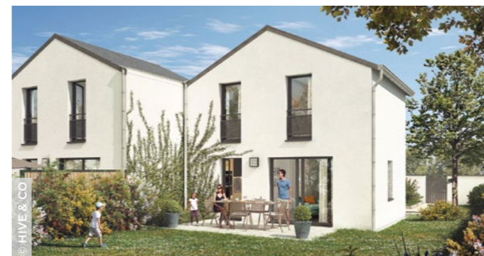
Les futures Maisons Rodin, en accession abordable (3F Centre Val de Loire).

patrimoniale datant du Moyen Âge, la résidence Les Tanneurs, Valloire Habitat annonçait la réhabilitation de 665 logements en 2024 pour un montant de 37 millions d'euros.