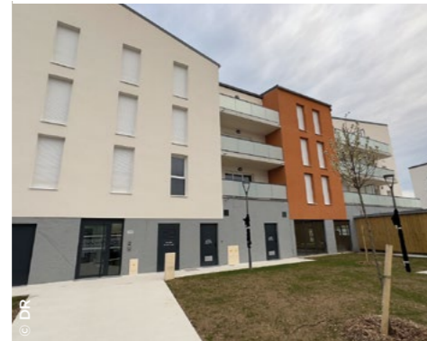
À Saran (45), la nouvelle résidence Farman, en locatif intermédiaire (Valloire Habitat).