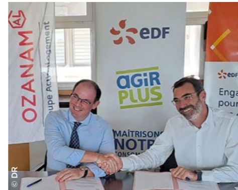
En Martinique, lors de la signature du partenariat entre Ozanam et EDF.