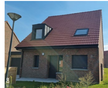
À Condé-sur-l'Escaut (59), ensemble de 40 maisons en accession abordable ( Foncière Logement ).