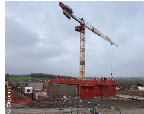
À Bruay-la-Buissière (62), construction d'une résidence intergénérationnelle ( Clésence ).