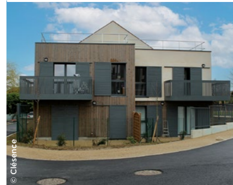
À Senlis (60), logements livrés dans le cadre d'Action Cœur de Ville ( Clésence ).