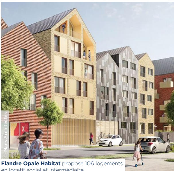
Flandre Opale Habitat propose 106 logements en locatif social et intermédiaire.

Pour soutenir la réindustrialisation du territoire dunkerquois (59), l'État, la Communauté urbaine de Dunkerque, la Banque des Territoires, les organismes HLM du territoire communautaire et Action Logement signaient en novembre dernier un contrat territorial 2024-2026 pour la production et la rénovation de logements sociaux. Le même jour, à Dunkerque, 3F Résidences et Flandre Opale Habitat posaient la première pierre de deux opérations qui s'inscrivent dans un programme d'ampleur de reconstruction de la ville sur la ville dans le quartier de la Citadelle, sur le site de l'ancienne Chambre de commerce et d'industrie (CCI).