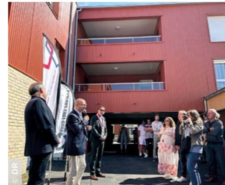
À Grand-Fort-Philippe (59), le 25 mai lors de l'inauguration de la résidence Baude ( Flandre Opale Habitat ).