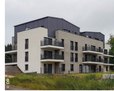
À Donville-les-Bains (50), la résidence La Herbedière, livrée en mai ( La Rance ).