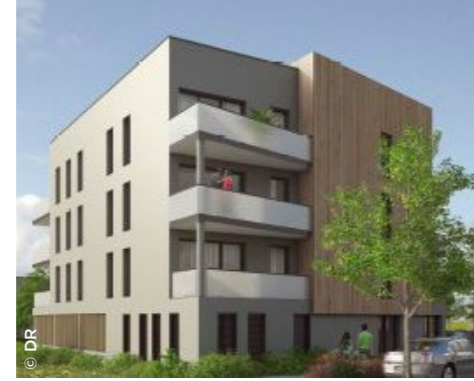
À Giberville (14), la future résidence Colibri ( 3F Normandie ).