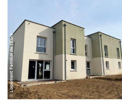
À Bueil (27), construction de 7 logements dont 3 individuels ( Logement Familial de l'Eure ).