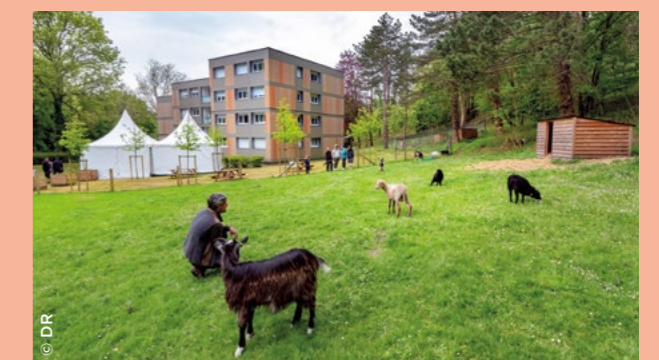
L'éco-pâturage de la résidence Les Pommiers, à Lillebonne (76).

À Val-de-Reuil (27), dans le quartier du Mail où ont été démolis 186 logements et 170 garages, 3F Normandie a recours à l'éco-pâturage avec 18 moutons d'Ouessant sur 2,6 hectares, en attendant le démarrage de la reconstruction prévu au troisième trimestre 2025. À Lillebonne (76), dans le cadre de la réhabilitation de la résidence Les Pommiers inaugurée en avril, Logeo Seine a mis en place l'éco-pâturage pour entretenir une importante surface d'espaces verts, dont une prairie de 1500 m 2 au nord du site. Ces dispositifs ont été déployés en partenariat avec les entreprises Écomouton et Côté Fermes, qui veillent au bien-être des petits ruminants. ●