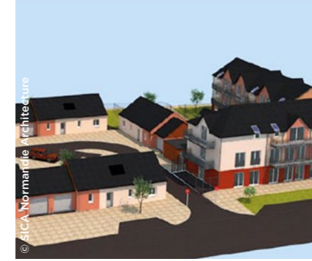
À La Ferrière-aux-Étangs (61), le futur ensemble composé de 24 logements ( Logissia ).