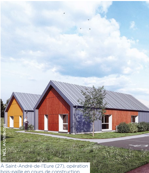
À Saint-André-de-l'Eure (27), opération bois-paille en cours de construction.

3F Normandie, Logeo Seine, Logissia et le Logement Familial de l'Eure , les quatre filiales ESH normandes du groupe Action Logement, renforcent leur mobilisation pour développer la filière bois/paille dans la région. Le 21 mars, elles signaient à Rouen (76) le Pacte bois et biosourcés normand, dont l'objectif est de massifier l'utilisation du bois et/ou de matériaux biosourcés dans les opérations de construction et de réhabilitation, avec un objectif de 30 % de matériaux biosourcés français, lissé sur quatre ans.