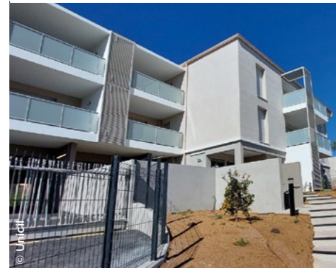
À Brignoles (83), la nouvelle résidence Le Mas des Orangers ( Unicil ).