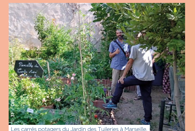
Les carrés potagers du Jardin des Tuileries à Marseille.

Dans le cadre de la mise en œuvre du Plan pour les économies d'énergie et la décarbonation déployé par l'ensemble des entités du Groupe, les initiatives pour préserver et pour développer la biodiversité se multiplient dans la région. Il s'agit d'intégrer la biodiversité dans les cahiers des charges des opérations de construction et de réhabilitation. Chez 3F Sud , cela se traduit par des initiatives telles que la création de jardins partagés au pied des résidences, qui favorisent la renaturation et la sensibilisation à la biodiversité, mais aussi les circuits courts, les économies alimentaires, et le lien social. À l'image du jardin potager mis en place au sein de la résidence Les Jasmins à Grasse (06), avec le partenaire local Soli-cités, ou encore des carrés potagers du Jardin des Tuileries à Marseille (13), qui ont été distingués en 2022 par le Concours national des jardins potagers dans la catégorie « Potagers partagés mis en place et cultivés au sein d'une entreprise ou par une association ». C'est également à Marseille, dans le 13 e arrondissement, que 3F Sud a mis en place des ruches sur le toit de la résidence du Clos Fleuri, en partenariat avec l'association HOP qui se charge de l'entretien et de la récolte du miel. Les pots de miel sont ensuite distribués aux résidents. ●