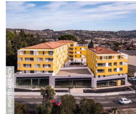
À Grasse (06), la nouvelle résidence Anthémis ( 3F Sud ).