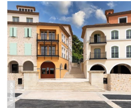
Au Rouret (06), la résidence Chemin des Comtes de Provence ( In'li Paca ).