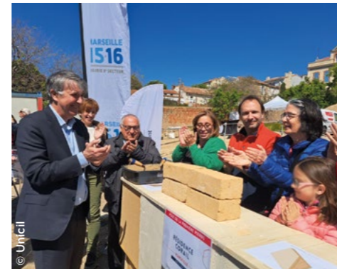
À Marseille (13), première brique en terre crue pour la résidence Corail ( Unicil ).