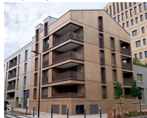
Au centre d'Angers (49), la nouvelle résidence Miroir (Podeliha).