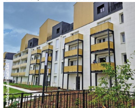
À Laval (53), la résidence La Coconnière après sa réhabilitation par Méduane Habitat.