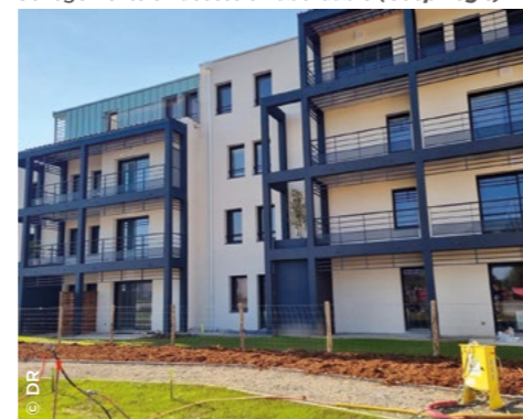
À Laval (53), Les Terrasses d'Hélios et ses 36 logements en accession abordable (Coop Logis).