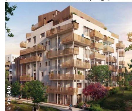
À Nantes (44), la future résidence Néo Essentiel (La Nantaise d'Habitations et Coop Logis).