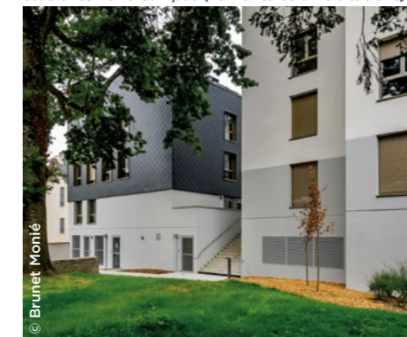
À Nantes (44), Imagin'Erdre, la 3 e résidence étudiante Loire Campus (La Nantaise d'Habitations).