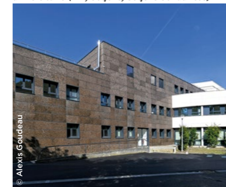
À Corbeil-Essonnes (91), la nouvelle résidence universitaire (FTI, Seqens, Seqens Solidarités).