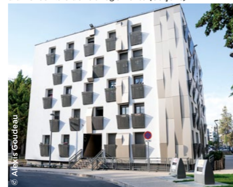
À Bobigny (93), réhabilitation et résidentialisation d'un ensemble de 190 logements (Seqens).