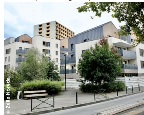
À Alfortville (94), la résidence En Seine dans le quartier Chantereine (Foncière Logement).