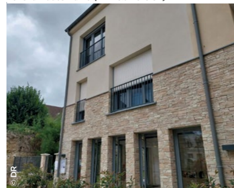
À Louveciennes (78), la résidence intergénérationnelle la Haute Barre (Immobilière 3F).