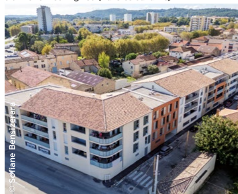
À Bagnols-sur-Cèze (30), la résidence intergénérationnelle Des Vignes (La Cité Jardins).