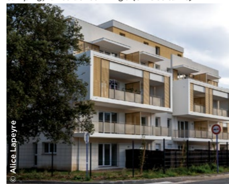
À Argelès-sur-Mer (66), sur le site d'un ancien camping, la résidence L'Argo (3F Occitanie).