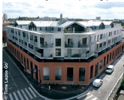
À Toulouse (31), la résidence Belles Rives, co-réalisée en maîtrise d'ouvrage avec Fonta (Promologis).