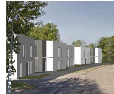
À Gueugnon (71), les futurs logements en cours de construction par Habellis .