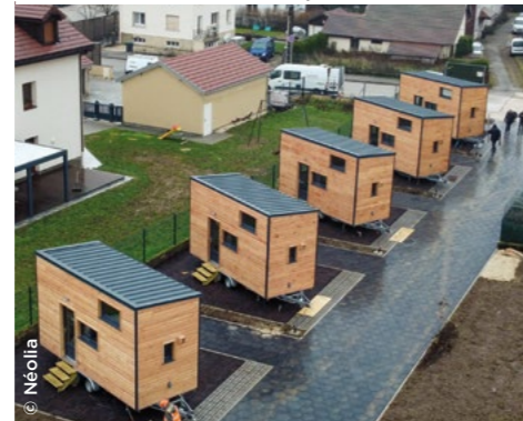
À Pontarlier (25), livraison de 5 tiny houses par Néolia dans le cadre d'un programme qui en compte 10.