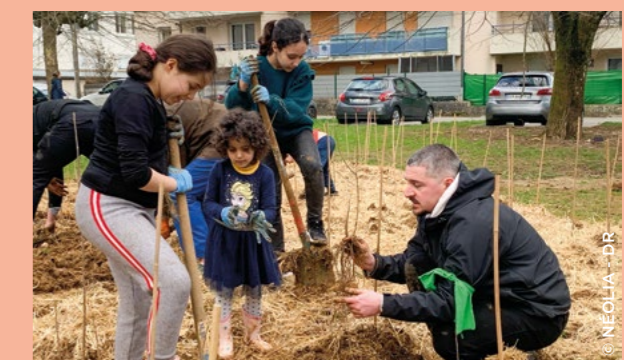
*Besançon a remporté le titre de « Capitale française de la Biodiversité 2018 ».

C'est dans une ville verte que Néolia a démarré la plantation de micro-forêts urbaines selon la méthode Miyawaki : après Besançon* (27) en février, ce sera au tour de Saint-Louis (68) et Strasbourg (67) de bénéficier de cette initiative de végétalisation en cœur de quartier. Réalisée en partenariat avec la Ville, la Métropole, Cœur et Canopée et la Maison de quartier Montrapon Fontaine-Écu, cette première opération a été co-financée par Néolia et Action Logement. Sur un espace limité, 2 îlots de 50 et 150 m 2 (l'équivalent de 12 places de parking), les micro-forêts ont accueilli 450 plants : des espèces locales d'une grande diversité qui mesureront 50 centimètres le jour de la plantation et gagneront 1 mètre par an. L'entretien est réalisé par les habitants, accompagnés par Cœur et Canopée. Au terme des trois premières années de croissance, la végétation sera autonome et nécessitera peu d'entretien. Les bienfaits de ce nouvel espace, qui permet de se (re)connecter à la nature et de favoriser le lien social, sont nombreux : soutien à la biodiversité locale en recréant des niches écologiques, absorption de CO 2 30 fois supérieure à la captation réalisée par des reboisements classiques, constitution d'îlots de fraîcheur (-2 °C), isolation visuelle et phonique (-10 dB), ombrage et coupe-vent pour les bâtiments, amélioration de la qualité de l'air par la fixation de poussières et de 15 % des particules fines, drainage des eaux et fixation des sols... ●