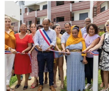
À La Réunion, à Saint-Paul, l'inauguration de la résidence Le Guillaume (la SHLMR ).