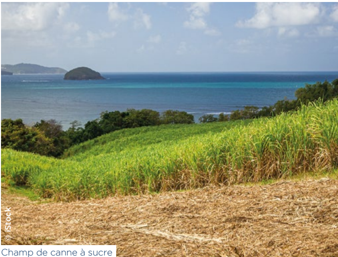
Champ de canne à sucre

Action Logement et l'entreprise Emerwall se sont rapprochés pour mener un projet visant à expérimenter Emerflex, solution biosourcée performante, dans le cadre de 10 opérations de construction et de réhabilitation portées en maîtrise d'œuvre par Ozanam , Sikoa et la SIFAG , en Martinique, Guadeloupe et Guyane entre fin 2023 et début 2025. Lauréat du Prix Coup de cœur de la 7 e édition du concours Innovation Outre-mer, Emerwall a conçu Emerflex, une solution d'isolation naturelle et locale réalisée à partir de bagasse de canne à sucre provenant exclusivement de distilleries martiniquaises, et bientôt guadeloupéennes. L'utilisation de ces panneaux isolants thermiques et acoustiques garantit l'autonomie sur les matériaux isolants, la création d'emploi local, l'amélioration du confort des usagers et la diversification des solutions d'économies d'énergie, tout en favorisant l'économie circulaire locale et le recours à des matériaux stockeurs de CO 2 .