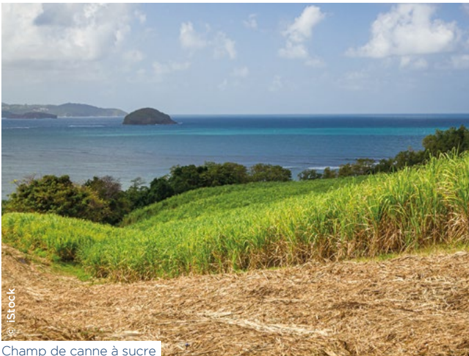
Champ de canne à sucre

Action Logement et l'entreprise Emerwall se sont rapprochés pour mener un projet visant à expérimenter Emerflex, solution biosourcée performante, dans le cadre de 10 opérations de construction et de réhabilitation portées en maîtrise d'œuvre par Ozanam , Sikoa et la SIFAG , en Martinique, Guadeloupe et Guyane entre fin 2023 et début 2025. Lauréat du Prix Coup de cœur de la 7 e édition du concours Innovation Outre-mer, Emerwall a conçu Emerflex, une solution d'isolation naturelle et locale réalisée à partir de bagasse de canne à sucre provenant exclusivement de distilleries martiniquaises, et bientôt guadeloupéennes. L'utilisation de ces panneaux isolants thermiques et acoustiques garantit l'autonomie sur les matériaux isolants, la création d'emploi local, l'amélioration du confort des usagers et la diversification des solutions d'économies d'énergie, tout en favorisant l'économie circulaire locale et le recours à des matériaux stockeurs de CO 2 .