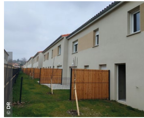
À Pont-du-Château (63), la résidence Le Clos du Vallon 2 (Auvergne Habitat).