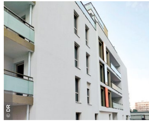
À Villeurbanne (69), la résidence Cœur Balzac (Alliade Habitat).