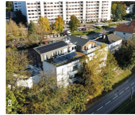
À Saint-Égrève (38), la résidence La Calandrelle (la SDH).