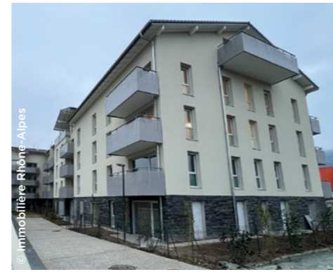
À Cessy (01), la résidence Les Villages d'Or (Immobilier Rhône-Alpes).