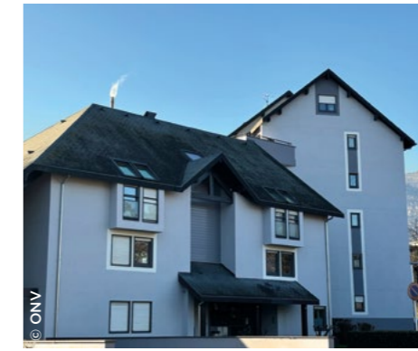
À La Motte-Servolex (73), la résidence dans laquelle l'ONV a réalisé sa 1 000 e vente.