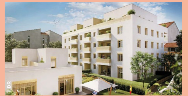
Dans le 4 e arrondissement de Lyon (69), la résidence Tilia, 23 logements en locatif intermédiaire (In'li Aura).

Pour développer ce segment d'une utilité sociale incontestable, en mars 2025, Action Logement a réorganisé ses opérateurs dédiés en un groupe unique, in'li, par la filialisation des 4 sociétés in'li en régions, in'li Aura , in'li Sud-Ouest , in'li Paca et in'li Grand Est auprès d'in'li (Île-de-France). Par ailleurs, Action Logement dispose depuis 2025 d'une plateforme en ligne ouverte aux demandeurs, qui peuvent postuler pour des logements intermédiaires disponibles. Enfin, les filiales d' Action Logement Immobilier diversifient leur offre en produisant elles aussi des logements intermédiaires, en complément des logements sociaux. Ainsi, en Auvergne-Rhône-Alpes, la part de logements intermédiaires est significative dans la production du Groupe: elle représente 46% des 4159 autorisations à construire obtenues en 2024, soit 1915 agréments. ●