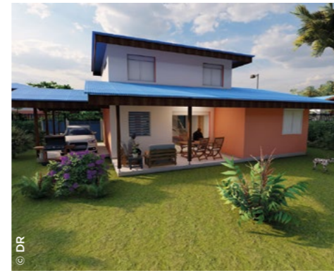
En Guyane, à Macouria, la future résidence Le Clos Belle Humeur (la SIFAG).