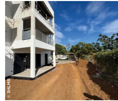
À La Réunion, à Saint-Paul, construction de la résidence Centaure pour étudiants et jeunes actifs (SHLMR).