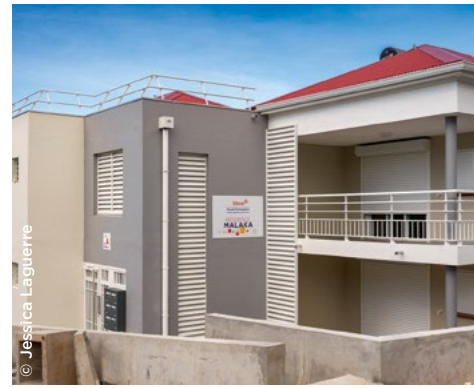
En Guadeloupe, à Basse-Terre, la nouvelle résidence Malaka (Sikoa).