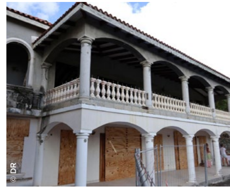
À Saint-Martin, à Friar's Bay, transformation de la résidence Isabella (Sikoa).