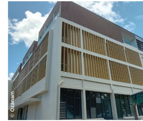
En Martinique, au centre-ville de Fort-de-France, la nouvelle résidence Les Jardins de Desclieux (Ozanam).