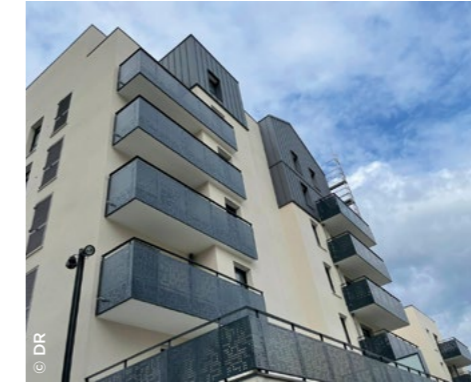
À Alfortville (94), offre nouvelle de 64 logements en accession (Foncière Logement).