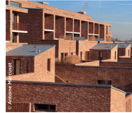
À Arpajon (91), ensemble de 56 logements, salles associatives et commerces (Immobilier 3F).