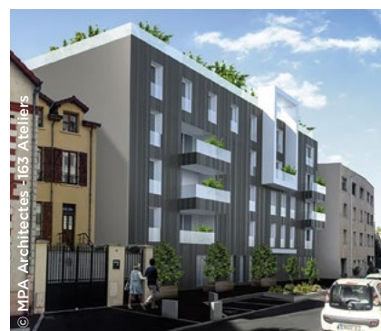
82 logements à Suresnes (92), rue Rouget-de-Lisle (Immobilière 3F et la FTI).

En Île-de-France, le Groupe est particulièrement actif. À Paris (75) pendant l'été, la FTI inaugurait avec Seqens 29 logements dans le 15 e arrondissement et livrait avec Immobilière 3F un ensemble de 12 logements, bureaux et commerce dans le 20 e arrondissement. Fin 2025, elle finalisait avec Immobilière 3F 75 logements à Jouy-en-Josas (78) et 82 à Suresnes (92), rue Rouget-de-Lisle. La FTI a démarré par ailleurs 4 programmes en 2025, notamment avec Immobilière 3F, 52 appartements et 1 commerce à Boulogne-Billancourt (92), et avec RIVP, 79 logements, des commerces et 1 crèche dans le 20 e arrondissement de la capitale, rue de la Plaine. De son côté, in'li démarrait en juillet à Paris, rue de Crimée, un projet intégrant la transformation de bureaux en 131 logements, y compris par l'extension et la surélévation du bâtiment. ●