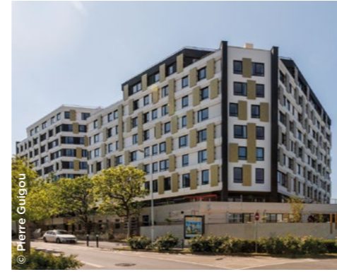
À Nanterre (92), la Cité internationale de la recherche pour étudiants, chercheurs et jeunes actifs (In'li).