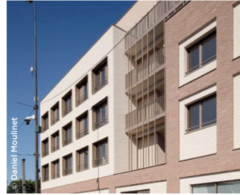
Au Vésinet (78), nouvelle résidence étudiante de 98 logements (Seqens Solidarités).