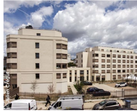
À Thiais (94), nouvelle résidence universitaire gérée par ARPEJ (3F Résidences).