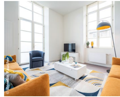
À Bressuire (79), l'espace de coliving de la résidence Place du Millénaire ( Immobilier Atlantic Aménagement ).