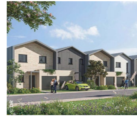
À Léognan (33), le dispositif Digneo propose 27 logements dont 10 maisons ( Foncière Logement ).