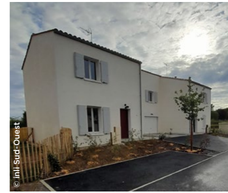
À Nérigean (33), la résidence Centre-Bourg, 4 maisons en locatif intermédiaire ( In'li Sud-Ouest ).