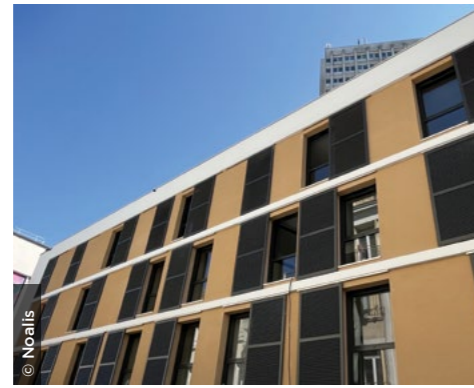
À Tulle (19), la résidence Yellome Côté Ville La Tour, pour jeunes actifs ( Noalis ).