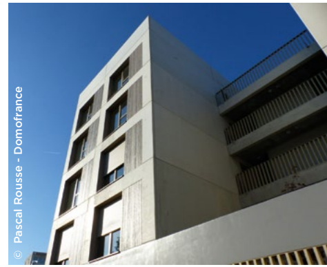
La résidence étudiante Claudeville à Bruges (33), à 6 kilomètres du centre de Bordeaux.