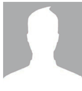
Désignation en cours