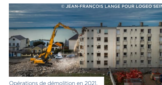
Opérations de démolition en 2021.