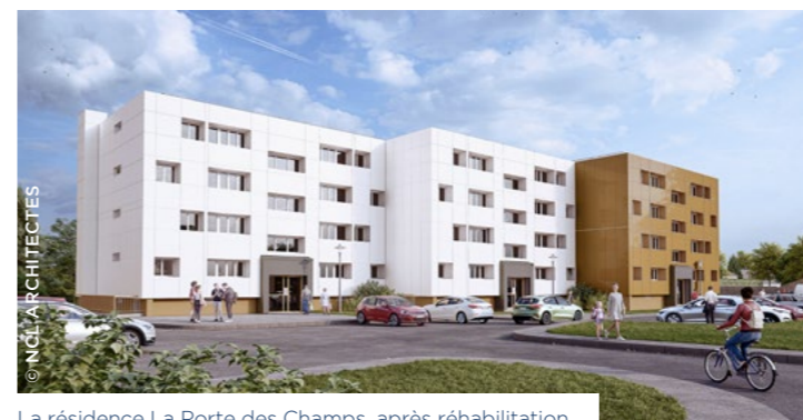
La résidence La Porte des Champs, après réhabilitation.

À Alençon (61), Logissia poursuit la réhabilitation de 248 logements dans le quartier de Villeneuve. L'objectif est d'améliorer le confort des habitants et de remettre à niveau l'aspect des façades, tout en améliorant les performances énergétiques du bâtiment. L'opération prévoit la réfection de l'étanchéité ainsi que l'isolation par l'extérieur qui aura pour conséquence le passage à une étiquette énergétique C, et pour les locataires, plus de confort et des factures d'énergie réduites. Livraison prévisionnelle au deuxième semestre 2023.