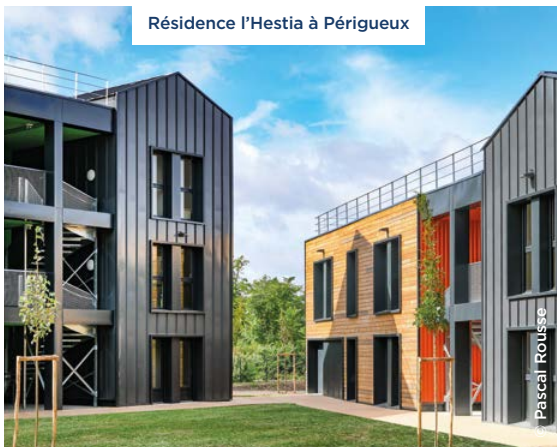
Résidence l'Hestia à Périgueux