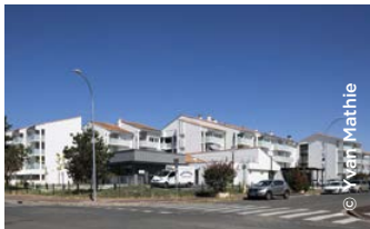
Résidence Autonomie Bel Air à Talence

Action Logement lance une fondation médico-sociale, Énéal , dont la vocation est d'acquiescer et de rénover des Ehpad et des résidences Autonomie, afin de renouveler une offre d'hébergement de qualité pour les personnes âgées aux revenus modestes.