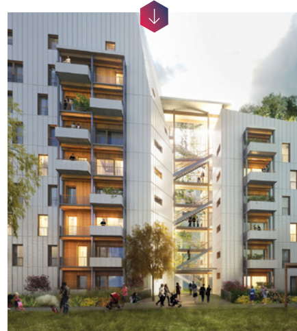
Perspective du projet novateur le Haut Bois à Grenoble. © Atelier 17C / ASP architecture

Au cœur d'un projet de renouvellement urbain d'envergure, le programme « Haut-Bois » incarne l'ambition portée par la ville de Grenoble : favoriser l'économie locale tout en relevant le défi de la transition énergétique. Initié par Actis , principal bailleur social de la Métropole, il s'agit d'un bâtiment passif à ossature bois sur 9 niveaux, comptant 56 logements et répondant aux normes sismiques locales. Une prouesse architecturale qui contribuera, dans le quartier Flaubert , à loger les salariés des entreprises de proximité. Lancée en février, la construction favorise les matériaux biosourcés et le développement des entreprises locales de la filière bois. Action Logement est partenaire à hauteur de 1,4 millions d'euros dont une aide exceptionnelle de 200 000 euros pour ce projet qui conjugue circuit court, préservation environnementale et production de logements.