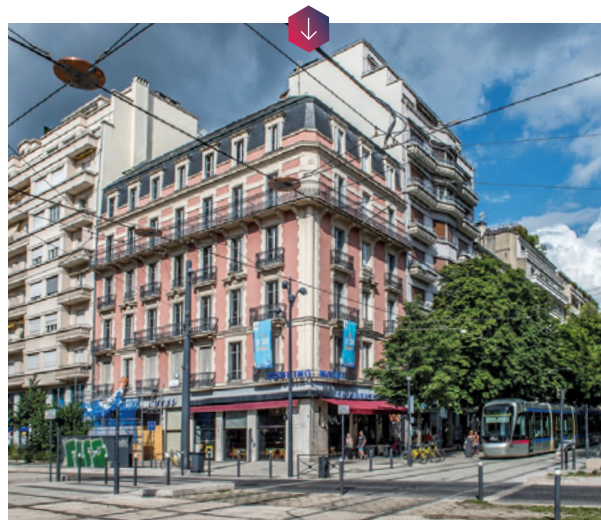
L'ancien « Touring Hôtel » proposera 31 logements au sein d'une résidence baptisée « Les Balcons de la Bastille ».

d'escaliers, de vitraux art déco, qui, déjà restaurés, ont été protégés durant les travaux. Cette résidence atypique s'inscrit comme une belle illustration du savoir-faire de la SDH pour valoriser l'ancien, en réponse aux besoins d'aujourd'hui.