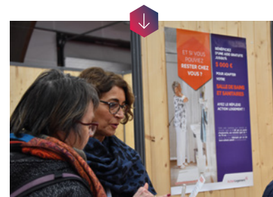
Action Logement présent au Salon des seniors de Rennes (31 janvier - 1 er février 2020).

En Bretagne, les plus de 60 ans sont en proportion plus nombreux qu'au niveau national. C'est l'une des raisons pour lesquelles Action Logement travaille avec l'ensemble des maires de la région afin de promouvoir l'aide à l'adaptation de la salle de bain au vieillissement. Le relais auprès des seniors est assuré par des supports de communication, adressés à chaque mairie, leurs Centres Communaux d'Action Sociale (CCAS), et leurs Centres Locaux d'Information et de Coordination (CLIC) afin de les accompagner dans leur mission de prévention et de développement social.