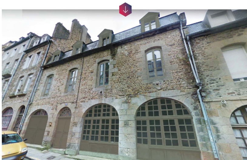
Fougères, rue de la Pinterie, projet de réhabilitation de 4 logements, maître d'ouvrage Fougères Habitat. © CF Architecture

11 villes bretonnes ont été retenues dans le cadre du programme national Action Cœur de Ville, particulièrement adapté à la physionomie régionale. Il permet à ces villes moyennes de développer des projets ambitieux de reconquête de leur centre-ville. En s'engageant financièrement aux côtés des différents partenaires, dont l'Anah, Action Logement participe pleinement à la redynamisation économique globale de ces communes. En tant qu'opérateur, le Groupe contribue ainsi à déployer concrètement une nouvelle offre de logements. Ce sont ainsi plus de 13 millions d'euros qui ont été engagés en Bretagne par Action Logement pour soutenir des projets d'acquisition-réhabilitation d'immeubles de logements au bénéfice des salariés. Les trois premières conventions immobilières ont été signées entre Action Logement et les collectivités de Saint-Brieuc, Vitré, et Pontivy et Action Logement a déjà confirmé son financement pour sept projets présentés par des bailleurs sociaux à Saint-Brieuc, Vitré, Fougères, Pontivy et Saint-Malo.