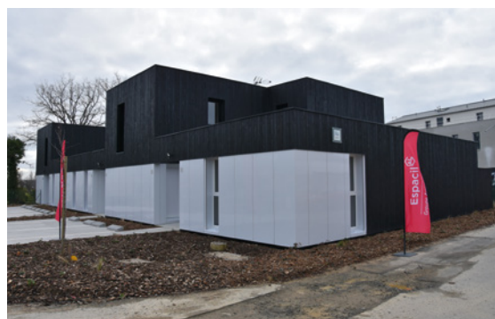
Le Clos de la Piquetière à Melesse : 6 maisons modulaires inaugurées par Espacil Habitat.