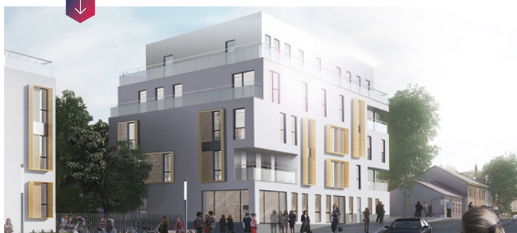
Vue perspective sur la future résidence. © Benoit Tribouillet architecte, Chartres développement immobiliers et BFP immobilier