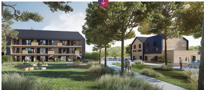
Bois Paille - Saint-Jean-de-la-Ruelle - Orléans Métropole © Limousin TCa et BP Architecture