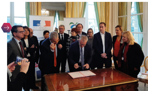
Signature du NPNRU de Tours Métropole le 27 janvier en présence de Madame la préfète d'Indre et Loire, avec Action Logement.

Aux côtés de l'État, de l'ANRU* et de nombreux partenaires, Action Logement intervient pour transformer les quartiers en difficulté, les rendre plus attractifs et améliorer les conditions de vie des habitants. En région Centre-Val de Loire, le Nouveau Programme de Renouvellement Urbain concerne 7 quartiers d'intérêt national et 11 quartiers d'intérêt régional. À ce jour, les projets validés envisagent 4 278 logements démolis, 2 073 reconstitués, et 5 682 requalifiés. Les dernières signatures pluriannuelles ont concerné Châteauroux, Tours et Bourges.