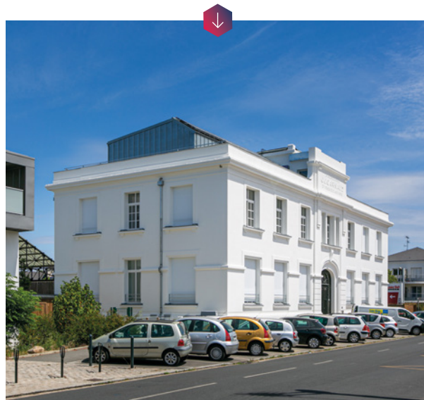
La Marseillaise : un des premiers bâtiments intelligents du territoire nantais.

Innovant, le projet a aussi pour objectif de responsabiliser les locataires, qui deviennent acteurs de leur consommation. Des informations sur le fonctionnement et le comportement énergétique du bâtiment sont diffusées sur un écran dans le hall d'entrée et des ateliers de sensibilisation aux économies d'énergie les forment aux réflexes éco-citoyens.