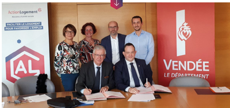
Signature de la convention cadre entre Action Logement et le Conseil Départemental, le 5 décembre 2019.

Louer Pour l'Emploi regroupe plusieurs aides d'Action Logement visant à rassurer le propriétaire et à accompagner le locataire : conseils personnalisés, subventions de loyer pour les jeunes alternants, avance du dépôt de garantie, cautionnement gratuit et sécurisation des revenus locatifs... Le bailleur peut également opter pour une subvention aux travaux de rénovation énergétique ou un prêt complémentaire au taux de 1 %. En contrepartie, il accepte d'appliquer un loyer plafonné et de louer son logement à un candidat labellisé. L'objectif : fluidifier le marché locatif privé, en encourageant les mises en location au profit de salariés, notamment de jeunes actifs, et ainsi favoriser leur accès à l'emploi.