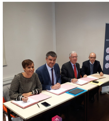
Signature de la convention avec Laval Agglomération

De nombreuses entreprises Choletaises rencontrent des difficultés de recrutement, alors même que le taux de chômage est au plus haut dans certaines régions voisines. Avec Pôle emploi et l'Agglomération de Cholet, Action Logement a mené le « POC Mobilité » : une expérimentation visant à rapprocher des demandeurs d'emploi d'Ile de France vers les postes à pourvoir à Cholet. Parmi 26 candidats à la mobilité, choisis pour participer à une première rencontre, 13 ont été invités à vivre une semaine d'immersion au sein d'entreprises participantes : Michelin, Grolleau et Caib. Un succès, puisqu'une promesse d'embauche a été signée pour 6 d'entre eux. Ils seront logés par Action Logement.