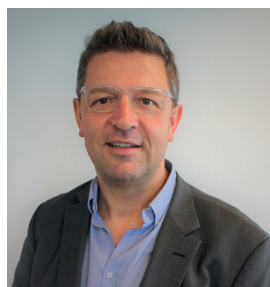
Jérôme COHADE (MEDEF)