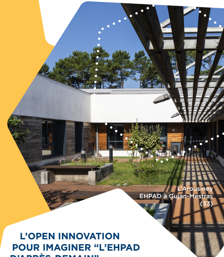
L'Arousiney EHPAD à Gujan-Mestras (33)

Énéal réinvente la relation propriétaire gestionnaire avec un contrat Partenarial d'Objectifs Partagés (POP). Grâce à cette démarche innovante, les gestionnaires engagés sur un haut niveau de qualité d'accueil, de prise en charge et d'accompagnement social bénéficieront de l'expertise de la foncière sur les sujets liés à la maintenance, la réhabilitation/rénovation, l'innovation sociale et la transition écologique.