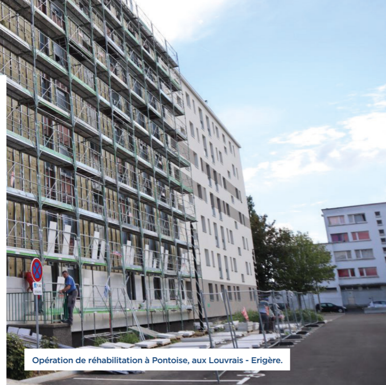
Opération de réhabilitation à Pontoise, aux Louvrais - Erigère.

À Antony, Immobilière 3F mène un projet de réhabilitation en milieu occupé, pour une résidence de 158 logements répartis dans 4 bâtiments. Le premier est terminé et les 3 autres sont en cours. Erigère pilote une opération de réhabilitation d'envergure à Pontoise, aux Louvrais. La filiale investit 70 millions d'euros pour réhabiliter 900 logements répartis dans 24 bâtiments. Déclinée en 4 phases d'intervention sur 6 ans, la première s'est achevée en novembre 2020.